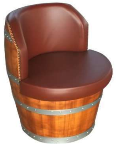
SPB002 Poltrona da botte senza fondi nuova in castagno tinta noce, lucidata a 2 mani, imbottita ecopelle (5 colori a scelta), diametro cm 69, schienale alto cm 75 Si abbina a tavolini bassi di cortesia.

SPB005 New hollow chestnut barrel armchair, walnut etched + coated, d.50cm, h.75 cm (pillow not included)