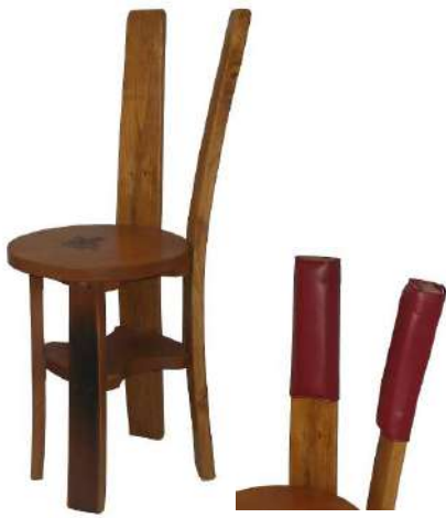
SSD004P Sgabello a 4 doghe con marchio a fuoco tinto noce, lucidato a 2 mani, seduta alta cm 48 Si abbina a tavoli alti circa 95 cm.

037/C Rivestimento per schienale sgabelli (tutti i modelli) in ecopelle, 5 colori a scelta Si abbina a tutti gli sgabelli con schienale