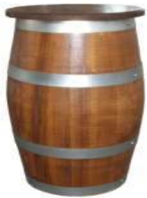
033/D Sgabello a botte in castagno tinto noce, lucidato a 2 mani, alto cm 45 Si abbina a tavoli alti circa 95 cm.

SSD006P 4 staves stool + backrest with firebrand, walnut etched + coated, seat h.80 cm, with footrest