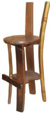
SSD005P Sgabello a 4 doghe con marchio a fuoco tinto noce, lucidato a 2 mani, seduta alta cm 65, con poggiatesta Si abbina a tavoli alti circa 95 cm.

037/C Eco-leather soft coat for backrest (all models), 5 colors available