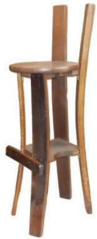
SSD006P Sgabello a 4 doghe con marchio a fuoco tinto noce, lucidato a 2 mani, seduta alta cm 80, con poggiatesta Si abbina a tavoli alti circa 115 cm o a banconi bar.

SSD005P 4 staves stool + backrest with firebrand, walnut etched + coated, seat h.65 cm, with footrest