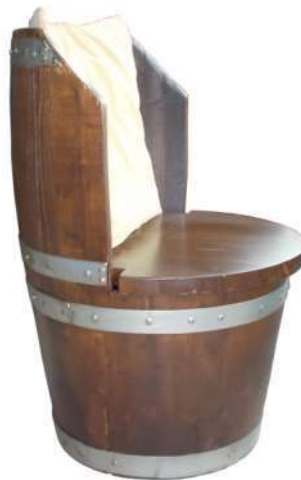
SPB005 (versione ) Poltrona da botte senza fondi nuova in castagno tinta noce (esempio noce scuro in foto), lucidata a 2 mani, diametro cm 50, seduta alta 40 cm, schienale alto cm 75 (cuscino escluso) Si abbina a tavolini bassi di cortesia, anche in esterno.

033/D Barrel chestnut stool, walnut etched + coated, h.45cm